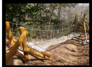
★12 モンキーブリッジ