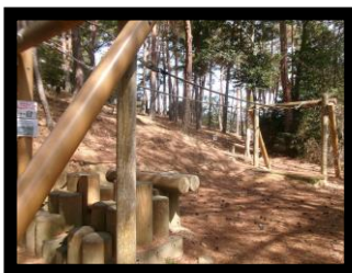
★9 レンジャー綱渡り