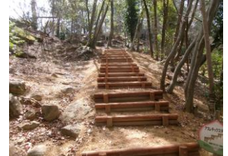
17 アスレチックステップ