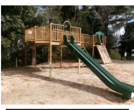
14 コンビネーション